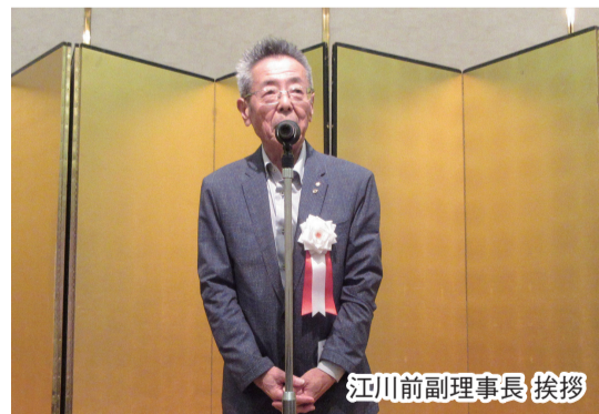
江川前副理事長挨拶